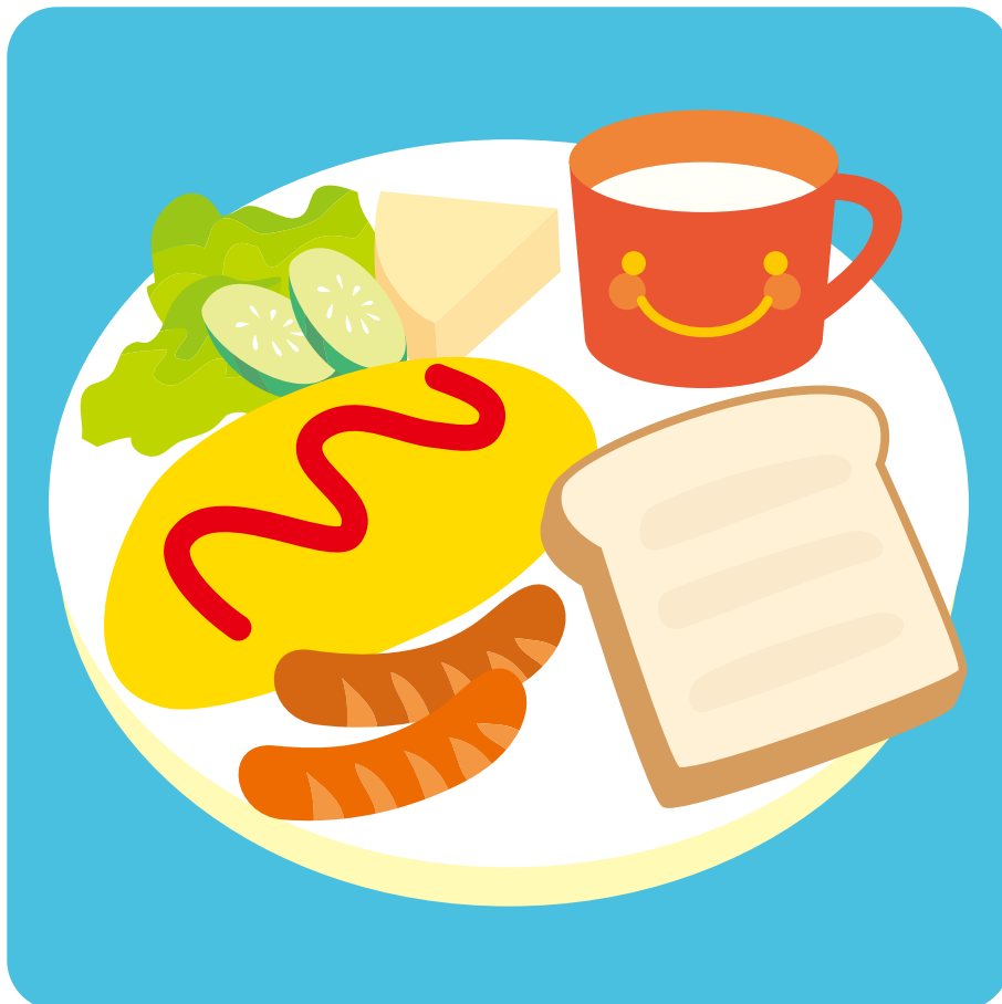
ポイント4 あさごはん