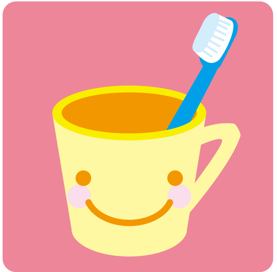
ポイント1 はみがき